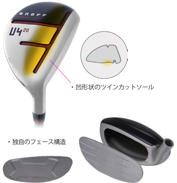
・凹形状のツインカットソール