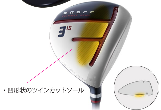
・凹形状のツインカットソール