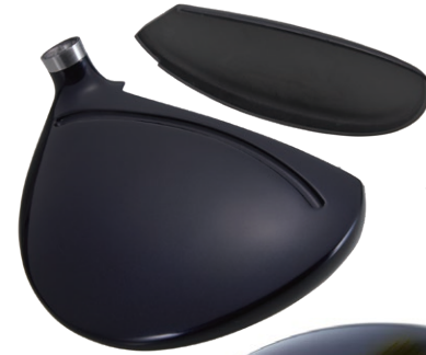
・カップフェース構造