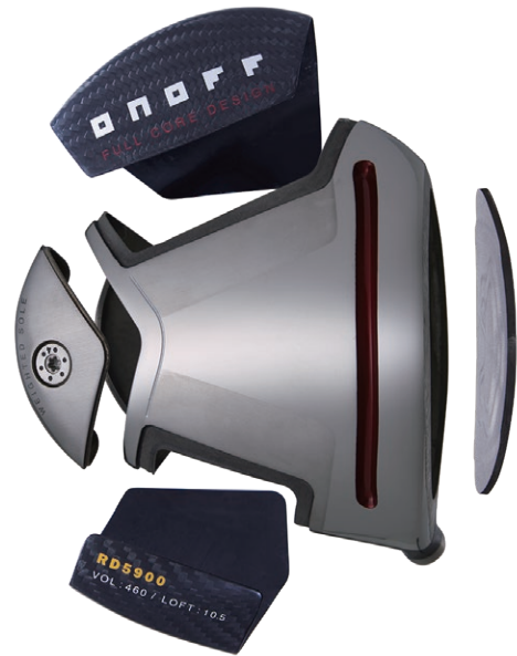
・5ピース構造の高慣性モーメントヘッド