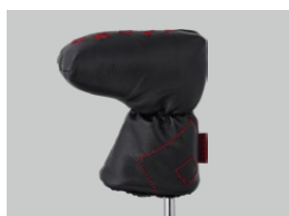
オリジナルヘッドカバー (Made in China) 付