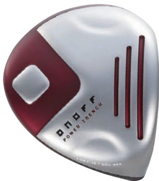
ONOFF DRIVER AKA