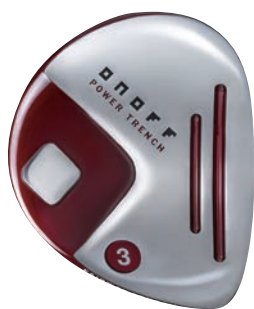
ONOFF FAIRWAY ARMS AKA