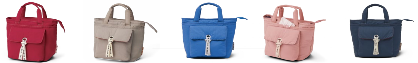
Round Bag OA0722 6,600円(税込) / 24x14x24cm / ナイロン / 抗菌素材ポケット付(マスク入れ等) / made in China