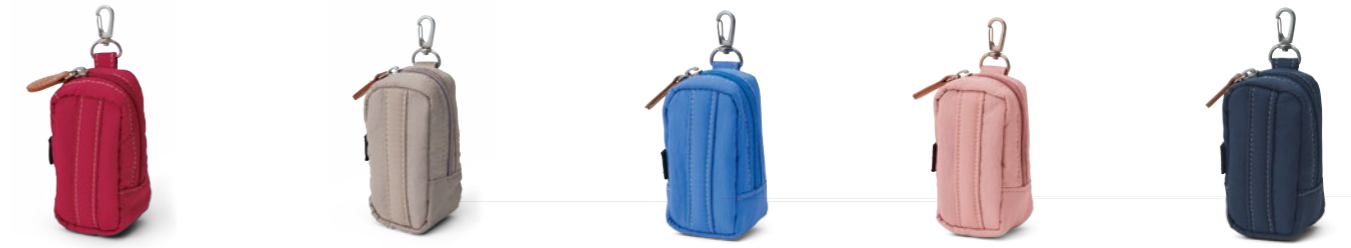
Ball Case OA1722 3,300円(税込) / 5x5x10cm / ナイロン / ボール2個、ティー3本まで収納可能 / made in China