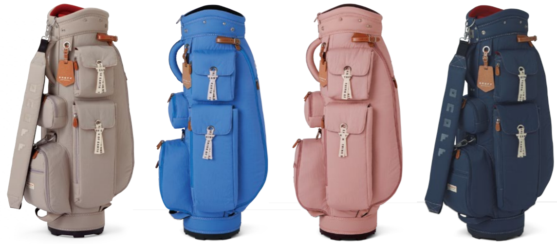
Caddie Bag OB0722 30,800円(税込) / ナイロン / ラオドラントネーム (消臭・抗菌効果)付 / 軽量タイプ / made in China