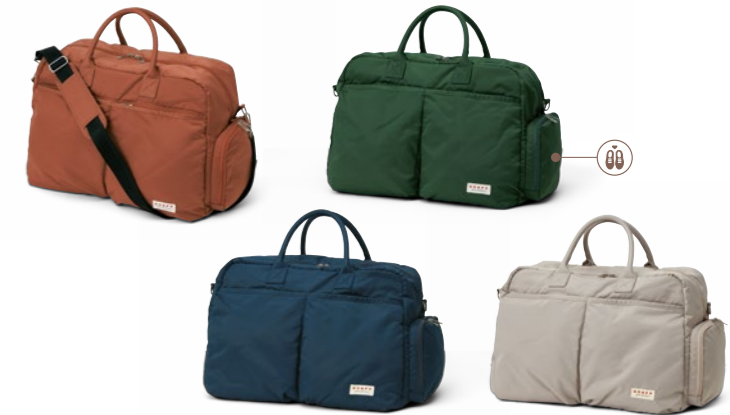
Boston Bag OV0424 18,700円(税込) / 48x27x33cm / ナイロン(ツイル織) / デオドラントネーム(消臭・抗菌効果)付 再生ポリエステル(裏地) / シューズポケット(サイド)、ショルダーベルト付 / made in China