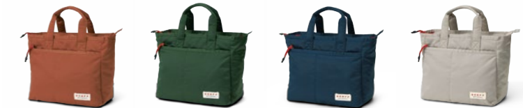
Round Bag OA1424 8,470円(税込) / 25x12x23cm / ナイロン(ツイル織)、再生ポリエステル(裏地) / 保温保冷 機能ペットボトルホルダー付 / made in China