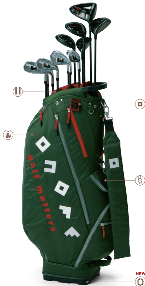
Caddie Bag OB3624