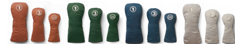
Head Cover OH0424 (W1用) 460cm 3 ヘッド対応・OH0524 (FW用) 取替式番手バッジ3.4、5、7.X付・OH0624 (UT用) 取替式番手バッジU3、U4、U5、U6付 / 各 3,960円(税込) / ナイロン(ツイル織) / made in China