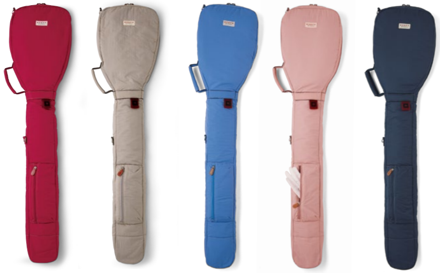
Club Case OL0722 12,100円(税込) / ナイロン / 収納可能クラブ本数6~7本程度 / made in China ⊕ 46inch