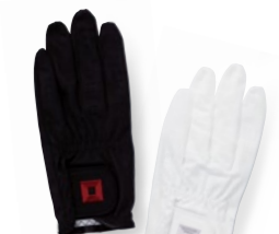
Glove Men's OG0624: 左手用 2,200円(税込) / 21~26cm 日本製合成皮革(ベルセムドライ®xEtak®) ブラック、ホワイト / made in Bangladesh