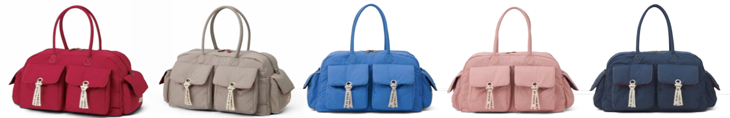
Boston Bag OV0722 15,950円(税込) / 49x25x28cm / ナイロン / ラオドラントネーム (消臭・抗菌効果)付 / シューズポケット(裏面下部)、ショルダーベルト付 / made in China ⊕