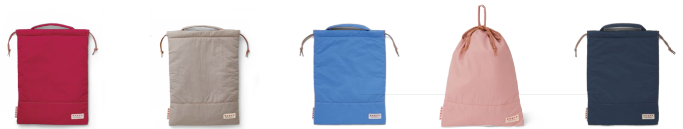
Shoes Case OC0722 4,400円(税込) / 30x40cm / ナイロン / ラオドラントネーム (消臭・抗菌効果)付 / 26.0cmのシューズまで収納可能(当社シューズ基準) / made in China